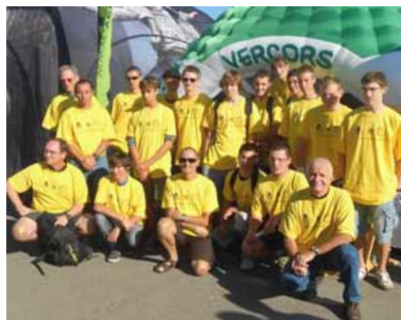
Groupe VTT jeune du CCSR

Alors pour cette 3 ème édition, venez nombreux pour passer un agréable et convivial moment dans l'ambiance amicale de notre association !